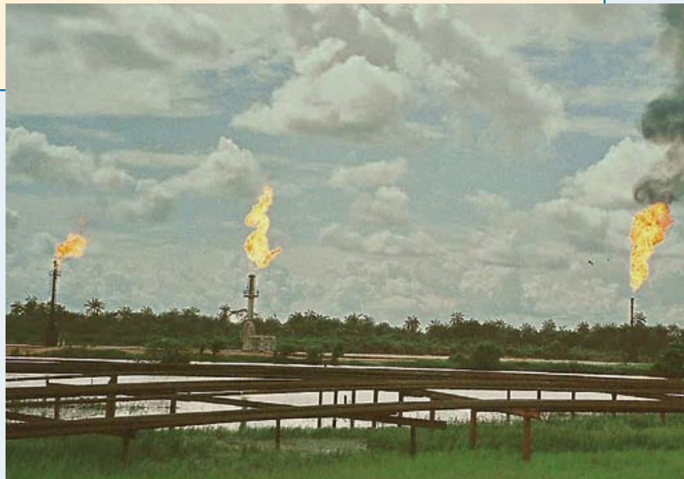
Gasabfackelstation im Nigerdelta.

Nichtregierungsorganisationen, die in der nigerianischen Publish What You Pay -Koalition zusammengeschlossen sind, hoffen, dass die Regierung durch ein neues Gesetz zu EITI endlich verpflichtet wird, vollständige Transparenz im Erdölsektor herzustellen.