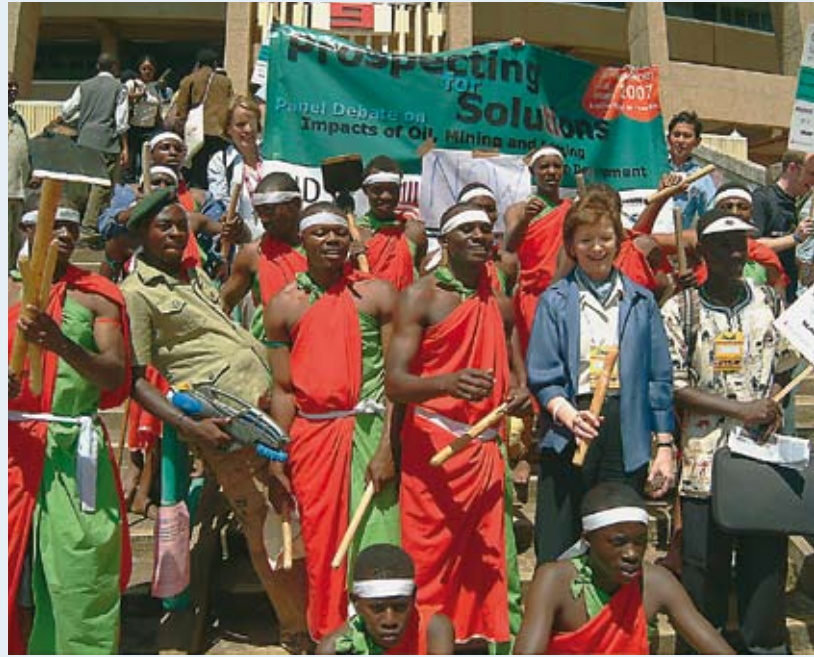
Weltsozialforum Nairobi 2007: Die Sangwa Amahoro-Musikgruppe demonstriert mit der ehemaligen UN-Menschenrechtskommissarin Mary Robinson für Transparenz und Verteilungsgerechtigkeit der Rohstoffeinnahmen.

ihren Jahresfinanzberichten Zahlungen an Regierungen offen zu legen. Der Herkunftsmitgliedstaat sollte darüber hinaus innerhalb des Rahmens, der auf verschiedenen internationalen Finanzforen aufgestellt wurde, zu mehr Transparenz bei solchen Zahlungen ermutigen 27 .