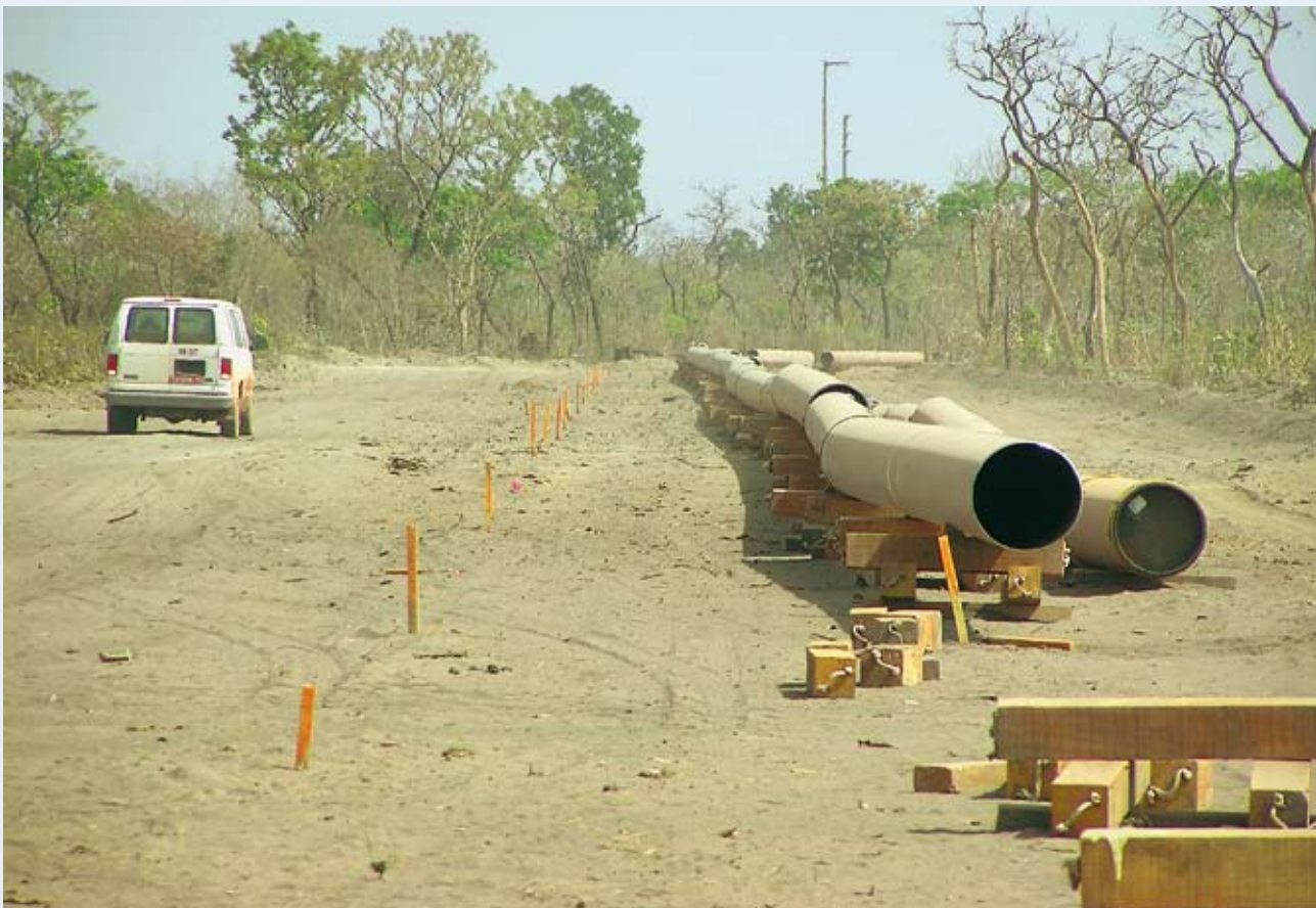
Bau der Tschad-Kamerun-Ölpipeline.

„Auf der internationalen Ebene sollte die deutsche Politik sich für Regelwerke zur Offenlegung von Zahlungsströmen aktiv einsetzen und die entsprechenden Institutionen und Organisationen zu geeigneten Initiativen auffordern. Ansatzpunkte hierfür bieten das Regelwerk des internationalen Kapitalverkehrs (z.B. die Prüfung der Einführung eines “International Financial Reporting Standard”), die Transparenzrichtlinien an den internationalen Börsenplätzen oder die EITIkomppatible Anpassung der ODA-Kriterien. Ziel der deutschen Bemühungen sollte es sein, ein für alle involvierten Akteure gleiches “level playing field” zu schaffen, das einen Bad-Practice-Wettbewerb vor Ort im Rahmen der Implementierung konkreter Vorhaben schon aus formalen Gründen ausschließt.“ 32