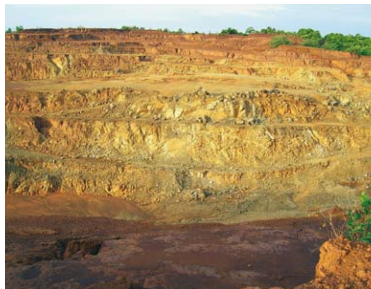
Auf der Philippinen-Insel Manicani Island: Nachdem hunderte Tonnen Nickelerz abgetragen worden sind, bleibt die Insel sich selbst überlassen.

Nationale und internationale Unternehmen, Regierungen und Finanzinstitutionen arbeiten im Rohstoffsektor Hand in Hand. Für die Sicherheit ihrer Energie- und Rohstoffversorgung wird oft auch nicht davor zurückgeschreckt, mit menschenverachtenden Regimen zu kooperieren. Korrupte Machteliten in vielen Rohstoffländern sind am schnellen Geld und weniger an der Entwicklung ihrer Länder interessiert. Bestechung