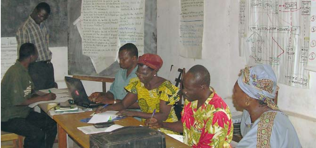
NROs im Tschad nehmen Erdöleinnahmen unter die Lupe.

zivilgesellschaftlicher Organisationen, die Bildung lokaler Gruppen und die Stärkung demokratischer Institutionen. An diesem Punkt setzt die weltweite NRO-Kampagne Publish What You Pay (PWYP) an.