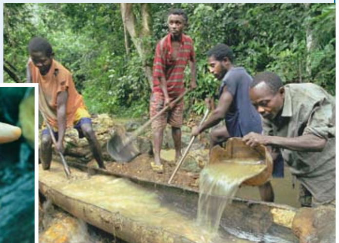
Coltan-Abbau in der D. R. Kongo: Das Erz Coltan dient zur Herstellung von Tantal, das unter anderem bei der Produktion von Handys verwendet wird.