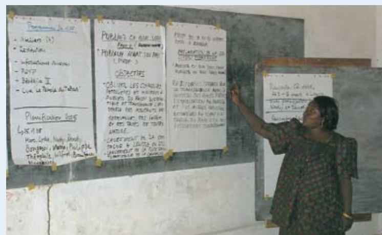
Mobilisierung für Publish What You Pay im Tschad.