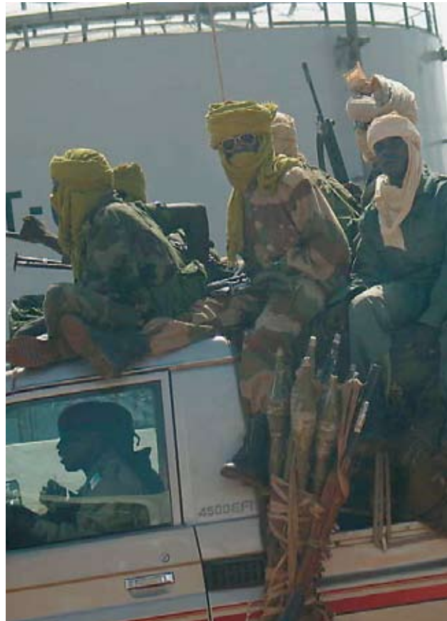
Rohstoffabbau unter Militärschutz: Soldaten bewachen Öltanks im Tschad.

Von den Investitionen und Aktivitäten des extraktiven Sektors selbst gehen in der Regel nur geringe Impulse für die Beschäftigung und die anderen Wirtschaftsbereiche aus. Nationale Zulieferer werden selten gebraucht, Weiterverarbeitung findet nur in geringem Umfang statt. Ob der Rohstoffreichtum in vielen Ländern Afrikas, Asiens und Lateinamerikas zukünftig positive Auswirkungen für die soziale und ökonomische Entwicklung der Länder hat, hängt daher davon ab, wie und von wem die Gewinne aus dem Rohstoffabbau verwendet werden. Aber wer profitiert bisher von diesen Gewinnen?