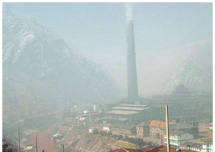
Erzverarbeitung in La Oroya, Peru: Freigesetzte Schwermetalle schädigen dort die Nerven und Atemwege von zehntausend Kindern.

Der Bergbau zerstört funktionierende landwirtschaftliche Strukturen, führt zur Verschmutzung von Trinkwasserquellen und Böden und verursacht Konflikte um Landbesitz. „Man sagt uns, dass Peru ein volkswirtschaftliches Wachstum zu verzeichnen habe. Dennoch geht die extreme Armut nicht zurück; die Gründe hierfür liegen in einem Wirtschaftsmodell, das keine gerechte Verteilung der allen gehörenden Reichtümer zulässt, sowie in ausgleichender Sozialpolitik, die nur begleitend wirkt, und nicht auf die Förderung einer echten menschlichen Entwicklung ausgerichtet ist“, so eine Erklärung katholischer Bischöfe Perus im November 2004. Die Situation hat sich – wie aktuelle Zahlen zeigen – bislang nicht substantiell verbessert.