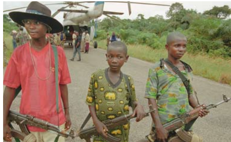
Kindersoldaten der Mayi-Mayi Rebellen in der D.R. Kongo bewachen eine Coltan-Verladeaktion.

Landes geführt; 3 und in der Demokratischen Republik Kongo konnten die Rebellengruppen im Osten des Landes ihren Krieg durch die zahlreichen Bodenschätze der Region (Coltan, Diamanten, Gold, Kupfer u.a.) finanzieren. In Nigeria schüren die enttäuschten Hoffnungen der Bevölkerung im Nigerdelta die Auseinandersetzung zwischen lokalen Gruppen und der Zentralregierung, die blutig ausgetragen wird.