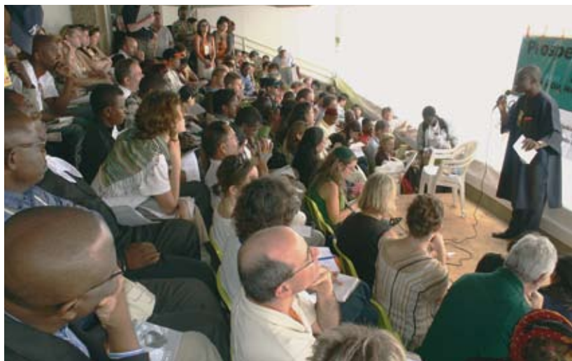
Auf dem Weltsozialforum in Nairobi 2007: Bei einer Podiumsdiskussion von CIDSE (Netzwerk katholischer Entwicklungsorganisationen aus Europa und Nordamerika) diskutieren Gruppen aus aller Welt, wie die Rohstoffeinnahmen gerechter verteilt werden können.

Rohstoffsektor eingefordert und sich für die gerechte Verteilung der Einnahmen ausgesprochen, damit der Rohstoffreichtum ihrer Länder wirklich zur Armutsminderung beiträgt. Misereor und „Brot für die Welt“ werden sie weiterhin in der Verwirklichung dieser Ziele unterstützen.