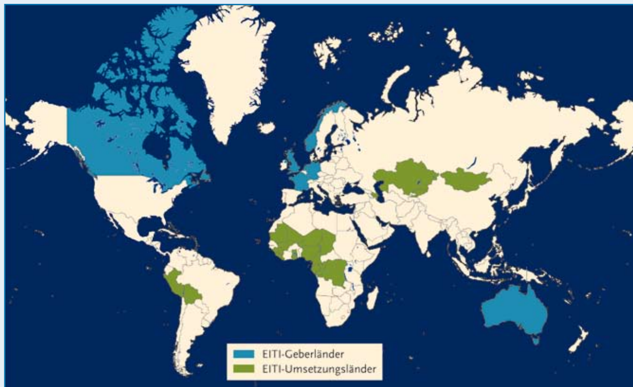
EITI Geber und Umsetzungsländer.