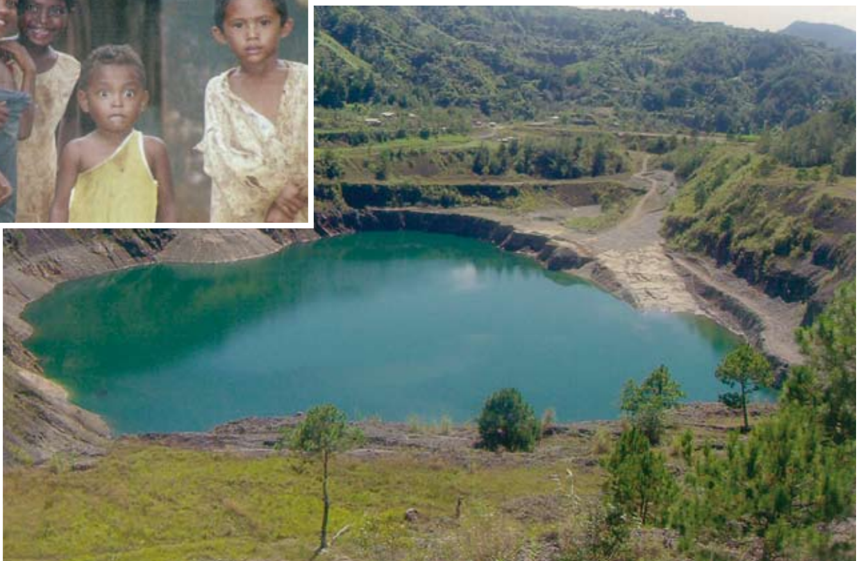
Lake Luba, Kibungan, Benguet, Philippinen: Der Schein trägt – Lake Luba war einst der zweitgrößte Berg von Kibungan. Nach elf Jahren Abbau plagen Bodenerosion und Wasserverschmutzung die Region.