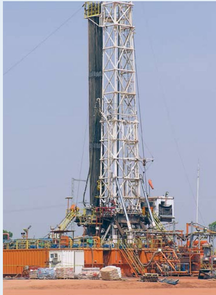
Ölbohrturm im Tschad.

Die PWYP-Koalition in Ghana fordert daher, dass EITI ein breiteres Mandat erhält, um all die anderen Probleme des Rohstoffabbaus, die bisher von der Initiative nicht behandelt werden, bearbeiten zu können. Dies schließt auch weitere Aspekte der Transparenz ein, einschließlich der Transparenz der Förderverträge, der politischen Entscheidungsfindung und der regulatorischen Maßnahmen.